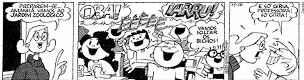
O Menino Maluquinho em quadrinhos, Ziraldo, L&PM.

Se quiser, convide um colega para ler junto e responder às perguntas.